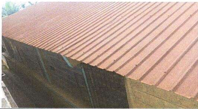
Foto1: Sustitución de lámina, por lámina troquelada aluzinc calibre 26, capotes y elementos de fijación.