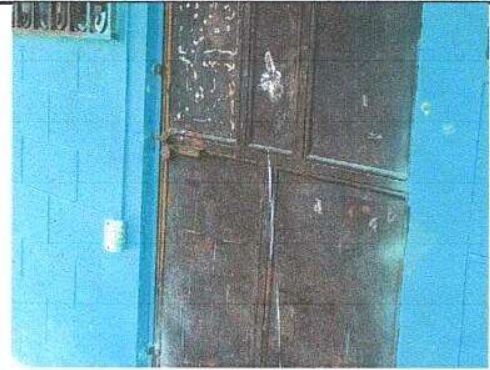
Foto 2: Mantenimiento a puertas (lijado, cepillado, sujeciones, aplicación de pintura), Sustitución de chapa